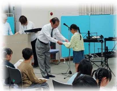
福祉の絵画・標語表彰式