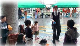
大道芸「ドリーマーズ」