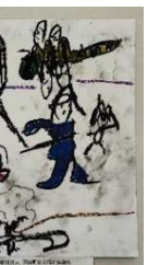
甲良西小学校1年羽様