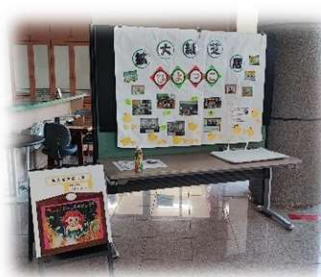
拡大紙芝居「ひよっこ」