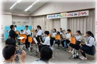
甲良中吹奏楽部演奏