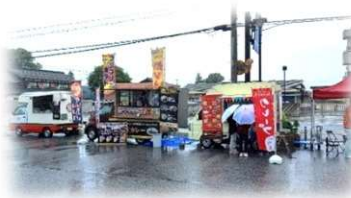
キッチンカー・模擬店